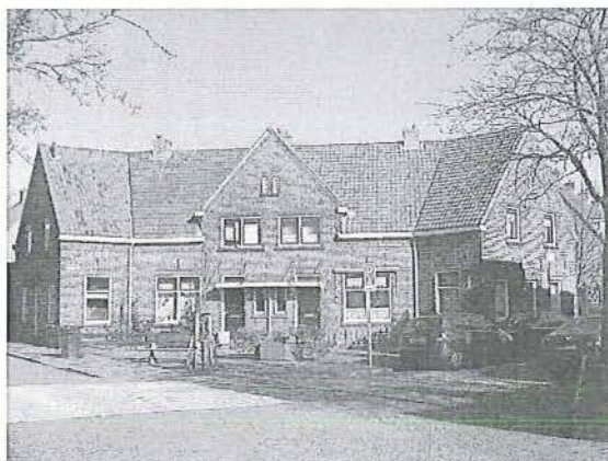
St. Josephstraat 51 / Mr. D.J. van Heusdestraat 1-5