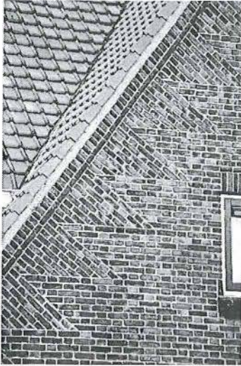
versieringen in het ambachtelijke metselwerk