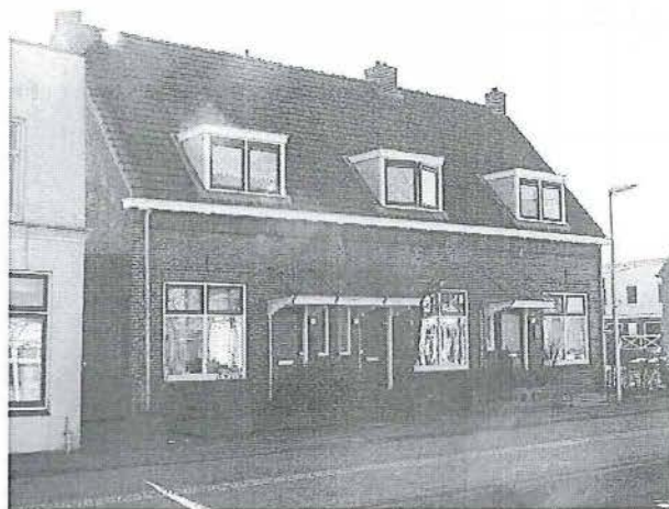
Karnemelksloot 62 en 62a-b