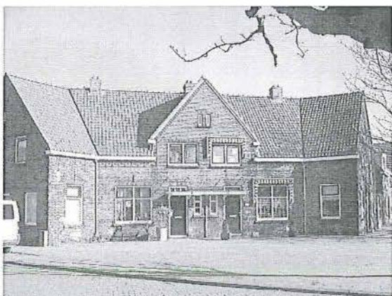
Lange van Wijngaardenstraat 5 / Zoutmanplein 4-6

De gevel aan het plein bevat op de begane grond een venster met draairaam en bovenraam. Ook boven deze vensters is een rollaag aangebracht.