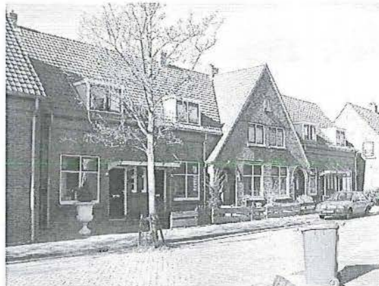
St. Josephstraat 66-76

Type 5 (de Lange van Wijngaardenstraat 1-3 / Zoutmanplein 11-12 / St. Josephstraat 2-4 / Zoutmanstraat 24-26 / Coornhertstraat 21 en 30). Op het kaartje wordt dit type met groen aangegeven.