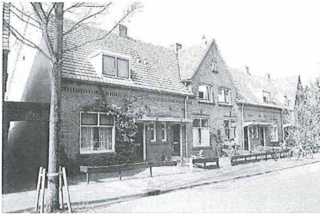
Mr. D.J. van Heusdestraat