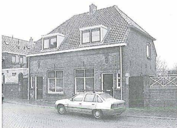
de Lange van Wijngaardenstraat 1-3

Aan de zuidwest-zijde van het Zoutmanplein liggen twee woningen onder één kap met een wolfdak van grijze Tuile-du-Nord. Op de begane grond van de voorgevel bezitten de woningen een kozijn met twee draaivensters en bovenklapvensters. De voordeur wordt geflankeerd door een zijlicht. Boven de deuren is een decoratie van baksteen gemetseld. De zijgevel bevat op de begane grond een klein draaivenster aan de straatzijde. Op de zolder wordt de zijgevel onderbroken door twee losse draaivensters die symmetrisch over de zijgevel zijn verdeeld. Deze woningen komen, hetzij in een iets gewijzigde vorm, op andere plaatsen in de buurt voor. Zo zijn St. Josephstraat 2-4, De Lange van Wijngaardenstraat 1-3, Coornhertstraat 21, 30 en Zoutmanstraat 24, 26 op een vergelijkbare wijze opgetrokken. De woningen aan de Coornhertstraat en de Zoutmanstraat hebben aan de voorzijde een driezijdige erker; de voordeur met bovenlicht is in de zijgevel geplaatst en bevat in een decoratieve gemetselde omlijsting.