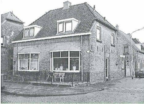
Zoutmanstraat 26 / Coornhertstraat 30

Type 6 (Zoutmanplein 19 / Zoutmanstraat 2 / St. Josephstraat 37). Op het kaartje worden deze panden met blauw aangegeven.