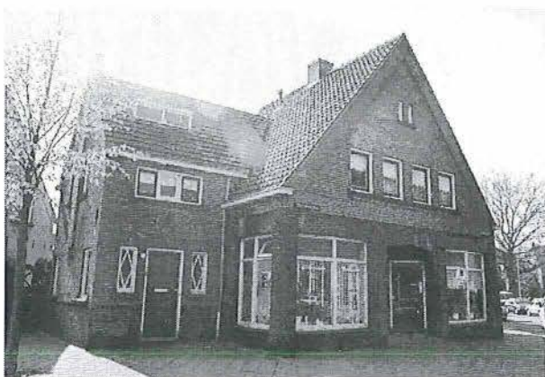
Voormalige buurtwinkel - Zoutmanplein 19 / Zoutmanstraat 2

De zijgevel aan de Coornhertstraat-zijde is op dezelfde manier opgebouwd als de voorzijde. In plaats van de voordeur zijn in dit geval twee schuifvensters en een driedelig etalageraam gemaakt. Aan de linkerzijde van het pand is een bevindt zich een later aangebrachte aanbouw van één bouwlaag.