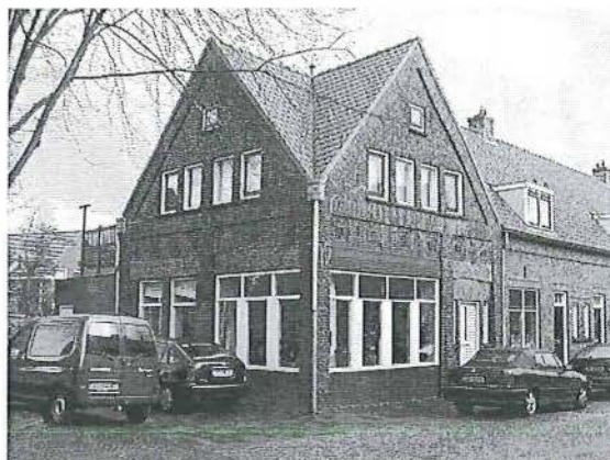
Voormalige buurtwinkel - St. Josephstraat 37