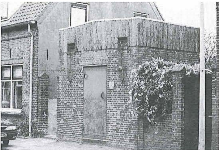
Transformatorhuisje, tussen St. Josephstraat 49 en 51

Aan het einde van de St. Josephstraat staat tussen nummer 49 en 51 een transformatorhuisje in overeenkomstige baksteenarchitectuur. Het gebouwtje is opgebouwd uit rode baksteen in Vlaams verband. In het midden van de gevel is een stalen toegangsdeur geplaatst, met een gemetselde rollaag. Op drievierde van de hoogte van het gebouwtje is tot de dakrand verticaal metselwerk toegepast, met een lichte helling naar het midden toe. Op de scheiding zijn in het verticale metselwerk twee vierkant ventilatieroosters aangebracht met een waterlijst. Onder de roosters is een geprofileerde decoratie van horizontale en verticale baksteen gemetseld.