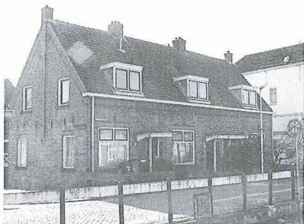
Karnemelksloot 56-60 (behoort niet bij de bescherming)